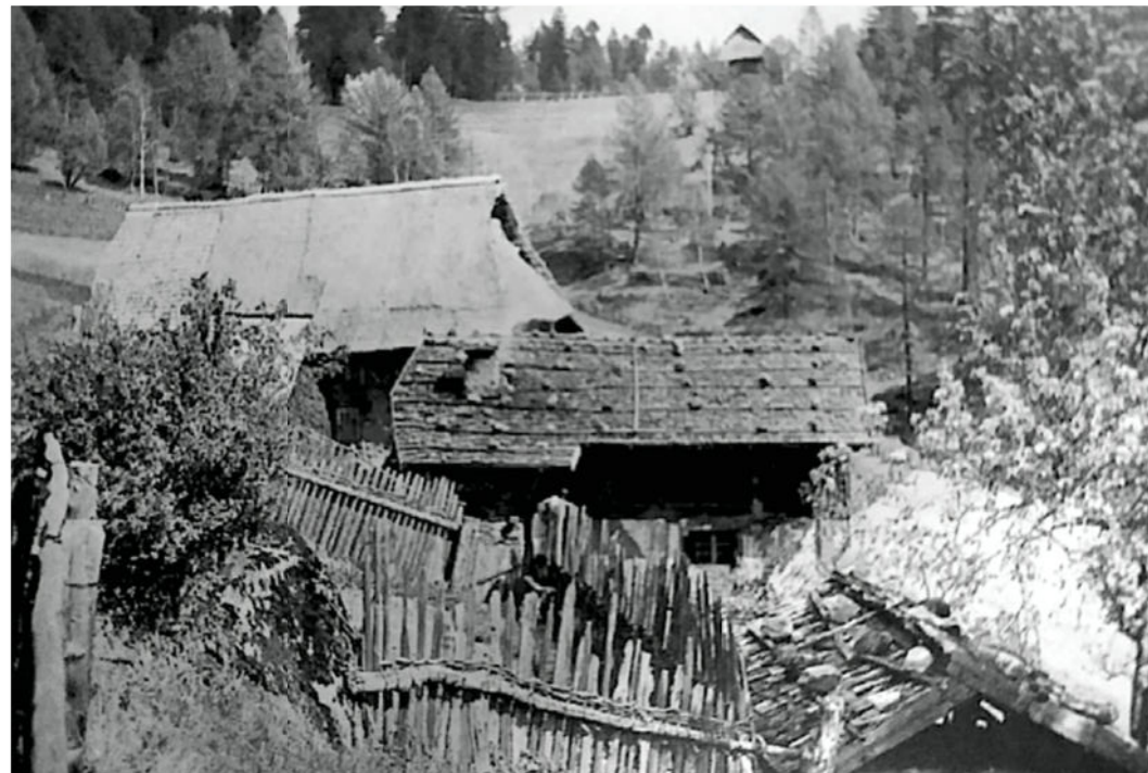
Der Hof im Jahr 1942