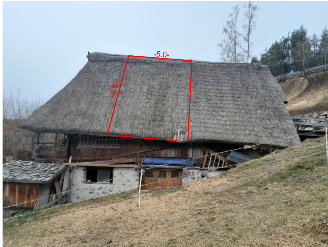
Der Hof im Jahr 2024 - Ostansicht