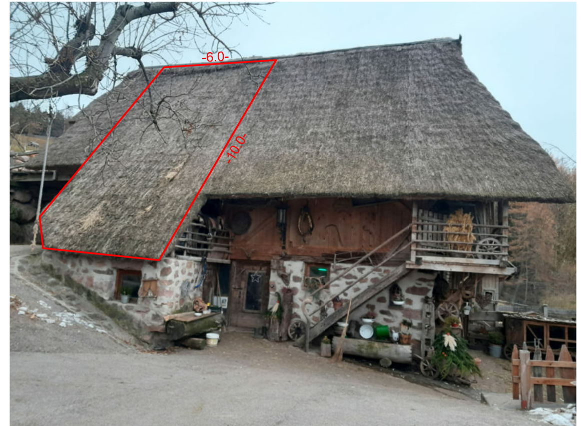
Der Hof im Jahr 2024 - Westansicht