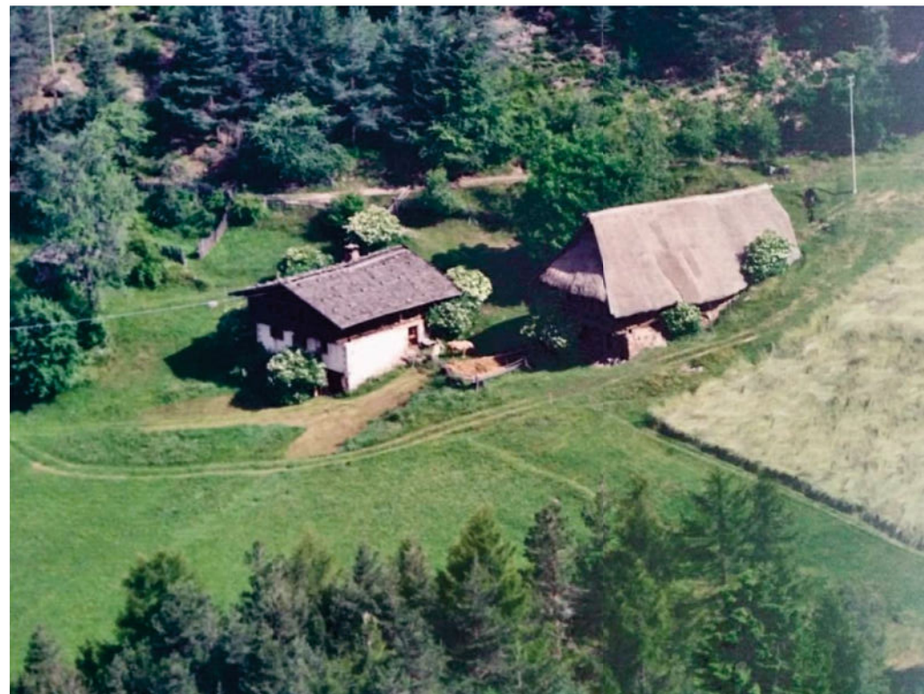
Der Hof in den Jahren 1960-70