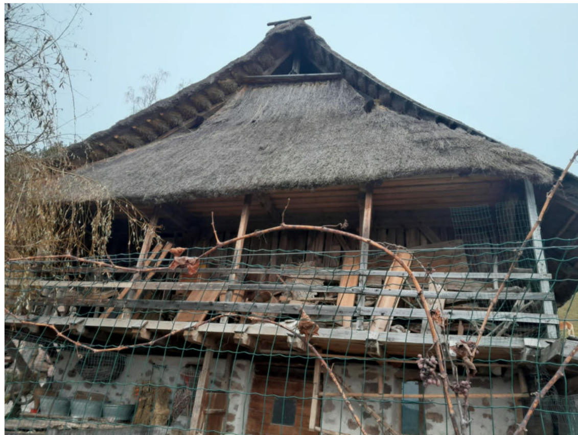
Der Hof im Jahr 2024 - Südansicht