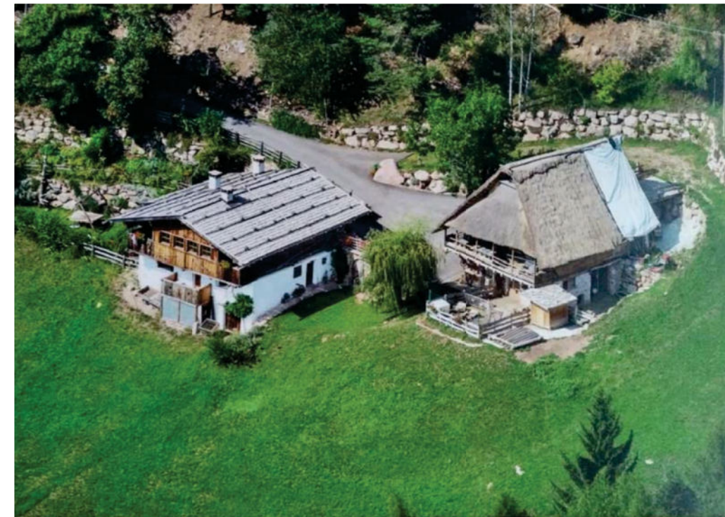
Der Hof im Jahr 2000