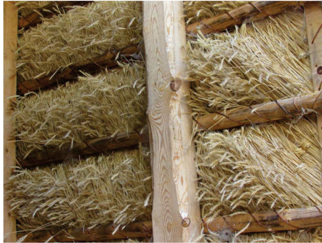
Detail zur Befestigung der Schab an den Dachlatten mit Weidenäste